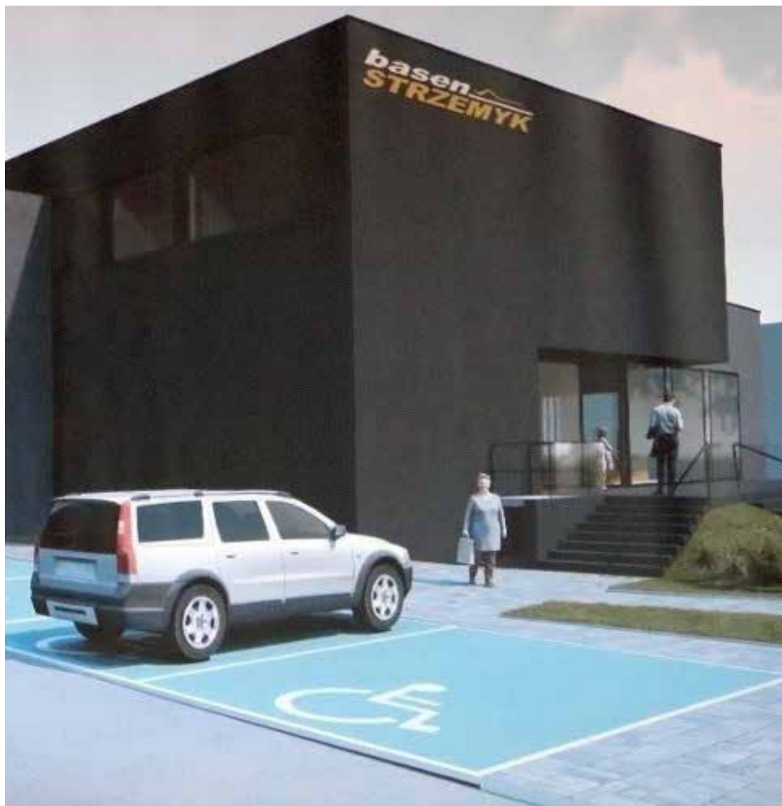
foto: wizualizacja pływalni Grudziądz

Miejmy nadzieję, że pływalnia w Jastrowiu ominie problemy, na które napotkali inni. Wszyscy mieszkańcy będą się cieszyli, że nie muszą jechać do innego miasta, aby popływać, bo na porządną pływalnię po prostu zasługujemy. Jednak trzeba mieć zawsze na uwadze, że nic nie jest za darmo i nie dajmy się nabrać na obietnice, które wyskakują jak „filip z konopi” bez wcześniejszej dokładnej analizy i podejścia zdroworozsądkowego, a nie emocjonalnego.